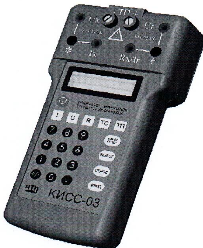
Рисунок 1 – Фотография общего вида

Схема пломбировки от несанкционированного доступа представлена на рисунке 2.